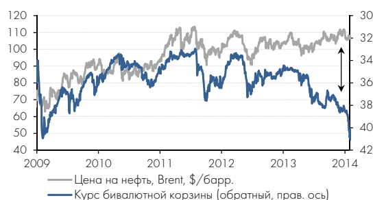
Динамика RUB против цены на нефть